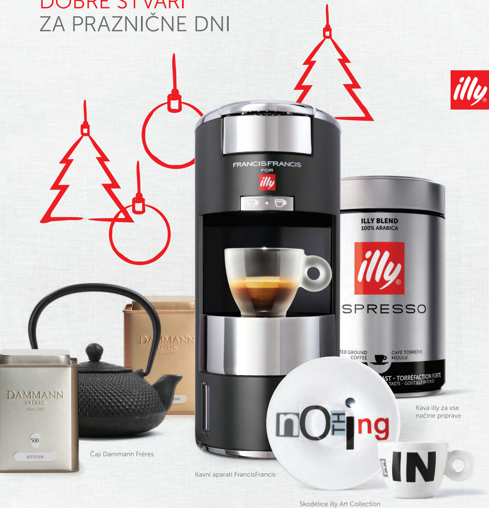
Čaji Dammann Frères