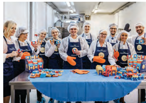
Uigrana in nasmejana ekipa.