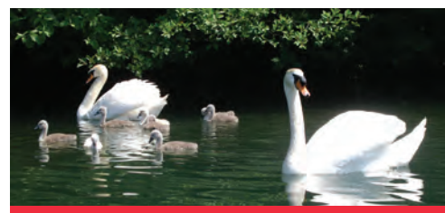
Prebudimo naravo za vse.

Zbiljsko jezero ni le prijetno zatočišče za izletnike in družine, temveč tudi za številne družine vodnih in obvodnih živali. Za le-te so pred 20 leti ob sanaciji jezera vzpostavili nadomestni habitat, ki pa je zaradi naravnih pojavov žal propadel. TD Zbilje želi urediti mokrišče, prijazno živalskim obiskovalcem od žab do labodov, ob mlaki pa postaviti učno pot z razgledno ploščadjo. Naj bo tvoj glas glas za prebujeno naravo.