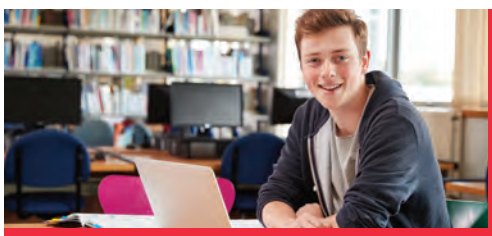
Vsak mladostnik naj izbere svojo pot.

Izbor zelenega srednješolskega programa predstavlja ključno razpotje v življenju vsakega mladostnika. Marsikatera družina zaradi materialne stiske svojemu otroku ne zmore ustrezno kriti »poti« do zelene izobrazbe. Zato so v okviru projekta Botrstvo v Sloveniji oblikovali poseben dijaški sklad, iz katerega financirajo bivanje v dijaških domovih in ostale stroške šolanja. Vsi mladi si zaslužijo enako priložnost. Naj tvoj glas mlade vodi do znanja in sanjskega poklica.