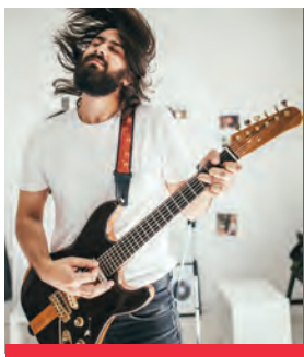
Spodbudimo sijaj mladih talentov.

Nadpovprečno sijajni rezultati na športnem, glasbenem, umetniškem ali izobraževalnem področju prinašajo ne tako sijajne visoke stroške za družine nadarjenih mladostnikov. Mnogi starši žal ne morejo